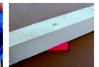
Nageldichtungen oder Nageldichtungsband

50212 in 260 cm, 50213 in 130 cm und 50214 in 65 cm