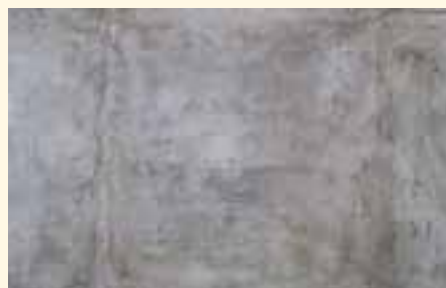
prima del trattamento anti-muffa vor der Anti-Schimmel-Behandlung