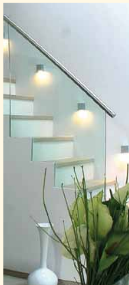
dopo l'applicazione della pittura anti-muffa nach dem Streichen mit Anti-Schimmel-Farbe

La pittura antimuffa AURO è facilissima da lavorare: basta stenderla con un pennello o un rullo sulle superfici a rischio muffe. A seconda del supporto, la resa del prodotto può variare da 0,10 a 0,14 l per metro quadro. La pittura non è indicata per gli ambienti perennemente umidi.