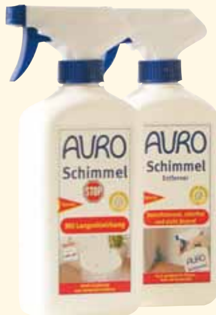
AURO: eliminatore di muffa e muffa-STOP AURO: Schimmelentferner und Schimmel-STOP