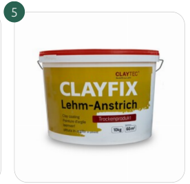
CLAYFIX Lehm-Anstrich (in Pulverform) Glatt/Feinkorn/Grobkorn Lehm-Anstrich ohne und mit Körnung für glatte Oberflächen im Innenbereich.