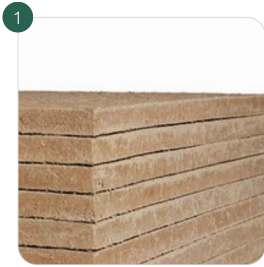
Lemix LEHMPLATTE Die innovative Lehmbauplatte