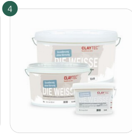
Grundierung DIE WEISSE Grundierung ohne Körnung für Lehmstrich, auf Lehmputzen und anderen Flächen