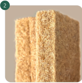
NATURAHANF FLEX Flexibler Dämmstoff aus Hanffasern