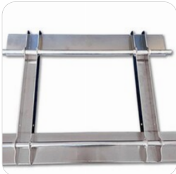
Lemix TH Tragehilfe für Lemix Lehmplatte