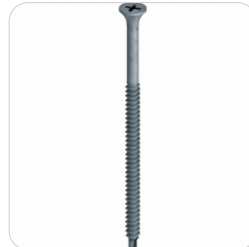
EJOT LEHMPLATTENSCHRAUBEN Lehmplattenschraube auf Metallkonstruktion