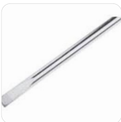
Alligator Wellenschliff-Messer Alligator Messersatz für weiche, flexible Dämmstoffe aus Holzfaser und Hanf