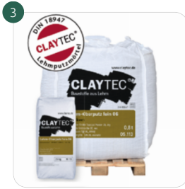
Lehmoberputz FEIN 06 Lehmfeinputz mit feinsten Körnung und Fasern