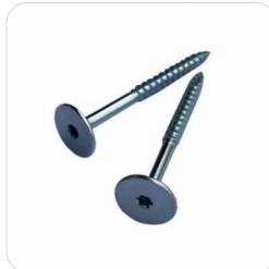
Lemix LEHMPLATTENSCHRAUBEN Lehmplattenschraube auf Holzkonstruktion